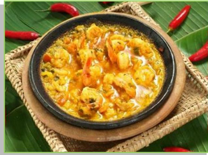
Moqueca de camarão com azeite de dendê

Salvador oferece uma grande variedade de alimentos em restaurantes, lanchonetes e “botecos” de todos os tipos. Encontra-se comida baiana, obviamente, mas também portuguesa, japonesa, italiana, francesa, natural (vegetariana) e muitas outras. De qualquer forma, ao chegar à cidade, é