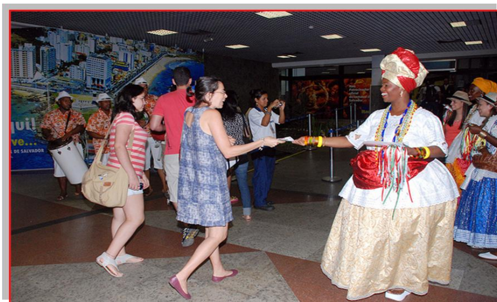
Recepção com baianas no Aeroporto Internacional Luís Eduardo Magalhães

Logo após o desembarque no Aeroporto Internacional Luís Eduardo Magalhães, ao deixar o local, o estudante intercambista é recepcionado pelo belo corredor de bambuzais da área externa. A pista de acesso ao aeroporto é circundada de um espaço verde muito bonito. À noite, o caminho é iluminado com luzes verdes e brancas.