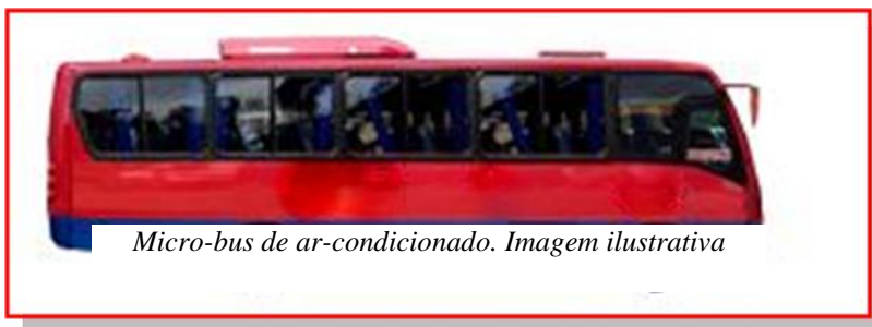
Micro-bus de ar-condicionado. Imagem ilustrativa

Os ônibus convencionais (tarifa abril 2014: R$ 2,80) não possuem ar-condicionado. Os executivos (tarifa abril 2014: R$ 3,00) possuem ar-condicionado, porém sua frota é menor e esses ônibus não circulam por todos os bairros de Salvador.