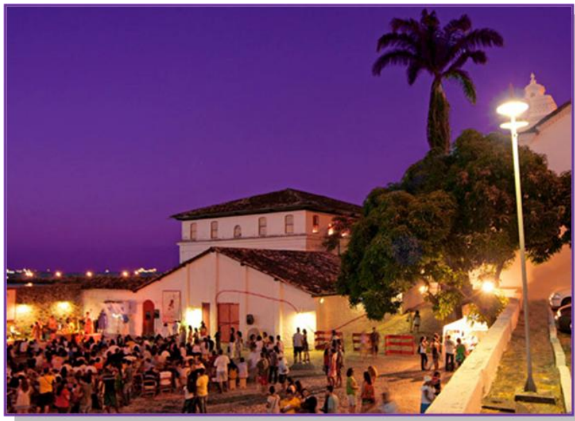
O projeto JAZZMAM acontece todos os sábados a partir das 18h

A cidade de Salvador é conhecida internacionalmente pelo seu forte potencial turístico e por sua efervescência cultural. Além das atividades promovidas pela UFBA, os alunos estrangeiros podem conhecer diversos pontos turísticos da cidade, dos quais listamos sinteticamente apenas os principais: