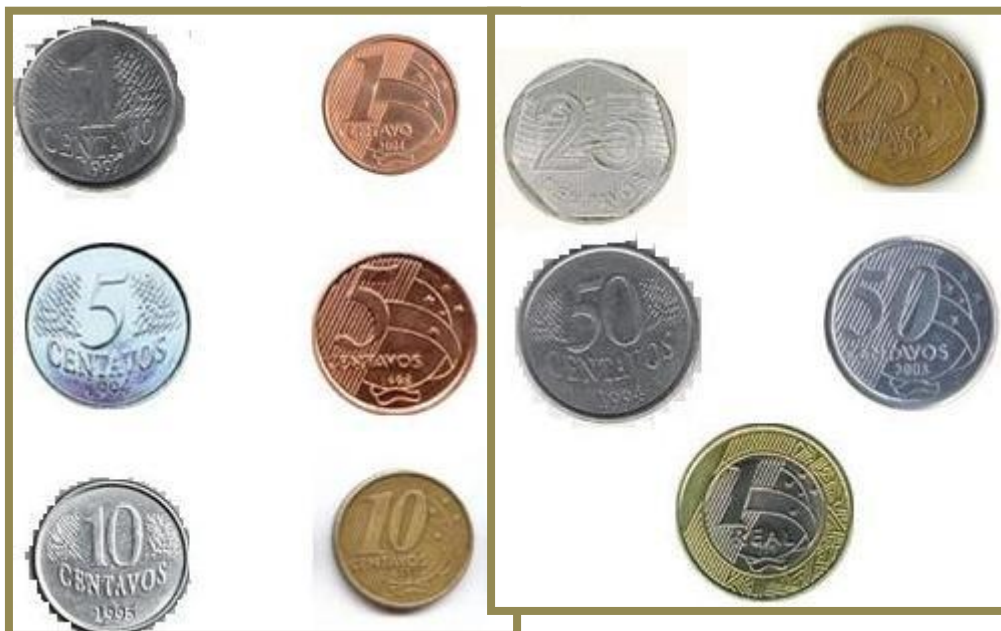
Moedas correntes no Brasil

Em 14 de agosto de 2014, entre dólar ($) euro (€) e real (R$) o câmbio (turismo) era o seguinte: