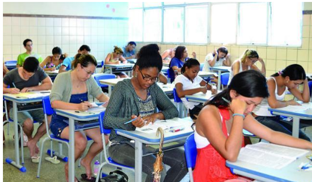
Jornal A Tarde