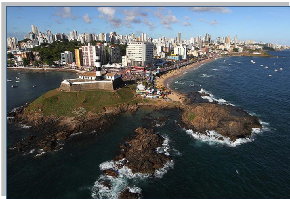
Imagem aérea de Salvador

Salvador, capital do Estado da Bahia, está situada na região Nordeste do Brasil e é uma cidade histórica. Fundada em 1549 por Tomé de Sousa, a cidade foi a primeira capital do Brasil até 1763. O governador-geral trouxe em sua comitiva funcionários da administração portuguesa, padres da Companhia de Jesus, soldados, degredados e trabalhadores da construção. Ao chegar à baía de Todos os Santos, Tomé de Sousa desembarcou na enseada da Conceição e subiu até a parte alta onde alcançou a colina escolhida para a construção da cidade-fortaleza do Salvador que foi edificada no modelo das cidades medievais da Europa ocidental com uma praça quadrada, com a Casa dos Governadores e a Casa da Vereança. Dali partiam duas ruas longitudinais - rua Direita do Palácio ou dos Mercadores (atual rua Chile) e a rua da Ajuda e dois caminhos para a praia. Edificado sobre uma falha tectônica que deu origem aos dois planos (Cidade Alta e Cidade Baixa, interligadas a partir de 1873 pelo Elevador Lacerda, famoso cartão postal), e de frente para a baía de Todos os Santos, o núcleo inicial de Salvador ficava em posição estratégica, ponto de observação privilegiado que propiciava a defesa contra invasores.